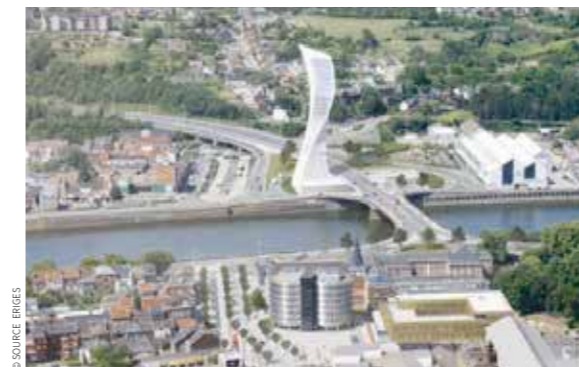
Le projet de tour de 30 étages proposé par la majorité socialiste.

Ecolo demande que les citoyens soient consultés sur ce dossier via une enquête publique, un comité d'accompagnement, un appel à projet participatif. Vos idées sont dès lors les bienvenues!