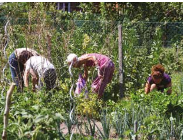
Récolte et entretien au potager collectif des Biens-Communaux.