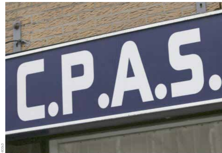
Le travail des assistants sociaux des CPAS mis en danger par la proposition de loi.