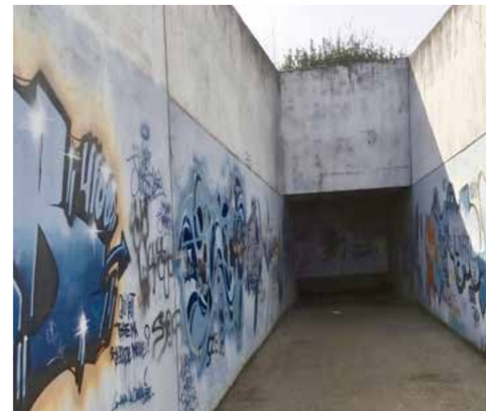
Une entrée sombre de jour et peu accueillante.